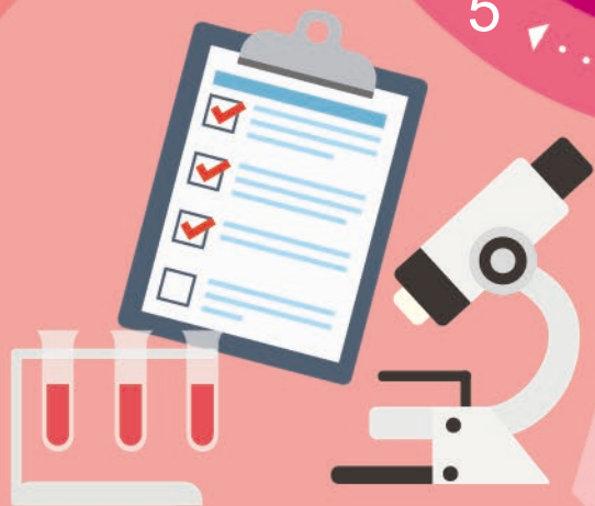
醫療團隊會進行相關檢查以及 配對以確定適合捐贈的器官