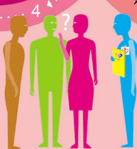
器官捐贈聯絡主任與病人家屬 討論並取得同意