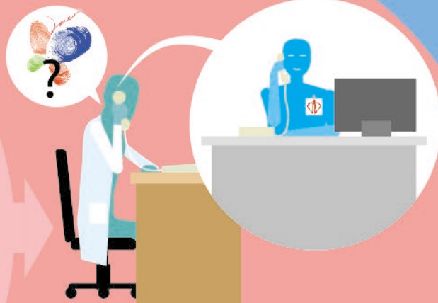
醫療團隊聯絡醫院管理局的 器官捐贈聯絡主任