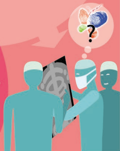
醫療團隊評估病人 是否適合捐贈器官